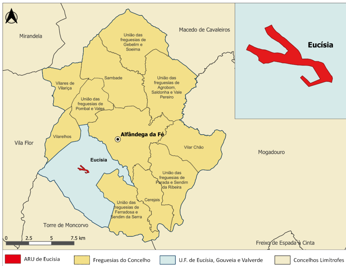
Figura 1. Enquadramento geográfico da ARU de Eucísia

A U.F. de Eucísia, Gouveia e Valverde contabiliza 266 habitantes, segundos os Censos 2021, distribuídos por um território de 50,8 km 2 . A aldeia de Eucísia dista da sede de Concelho cerca de 7,5 km (sensivelmente, 10 min) e compreende uma área total de 0,26 km 2 .