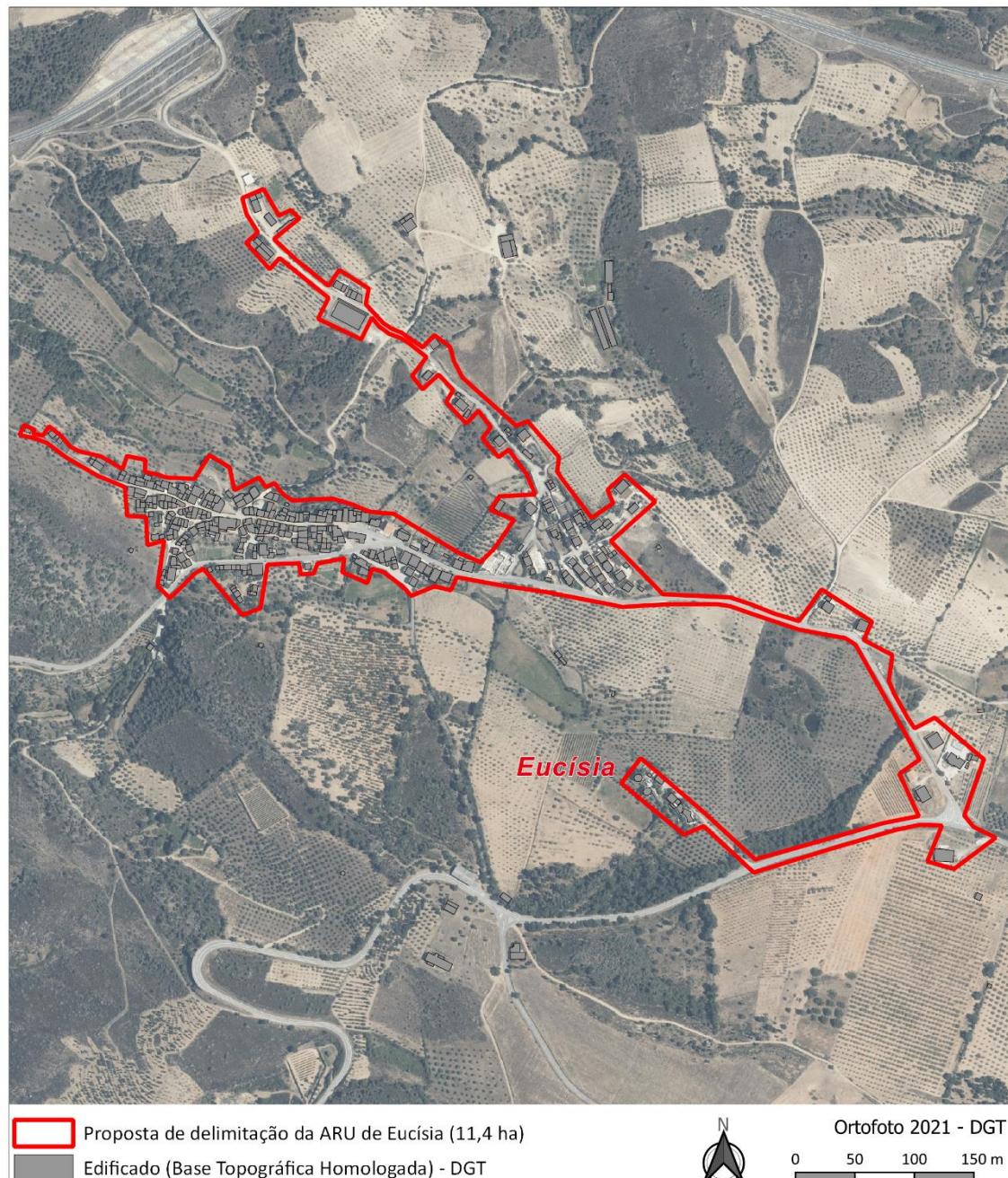
Figura 3. Delimitação da ARU de Eucísia sobre ortofotomapa

A proposta de delimitação da ARU de Eucísia considera 11,4 hectares. Esta proposta teve como base, a aferição entre a área englobada pelo perímetro urbano do PDM em vigor, o proposto em sede da 2. a revisão e a delimitação dos lugares estatísticos do INE. Apresentam-se em anexo as representações sobre o ortofotomapa de 2021 e a base topográfica homologada.