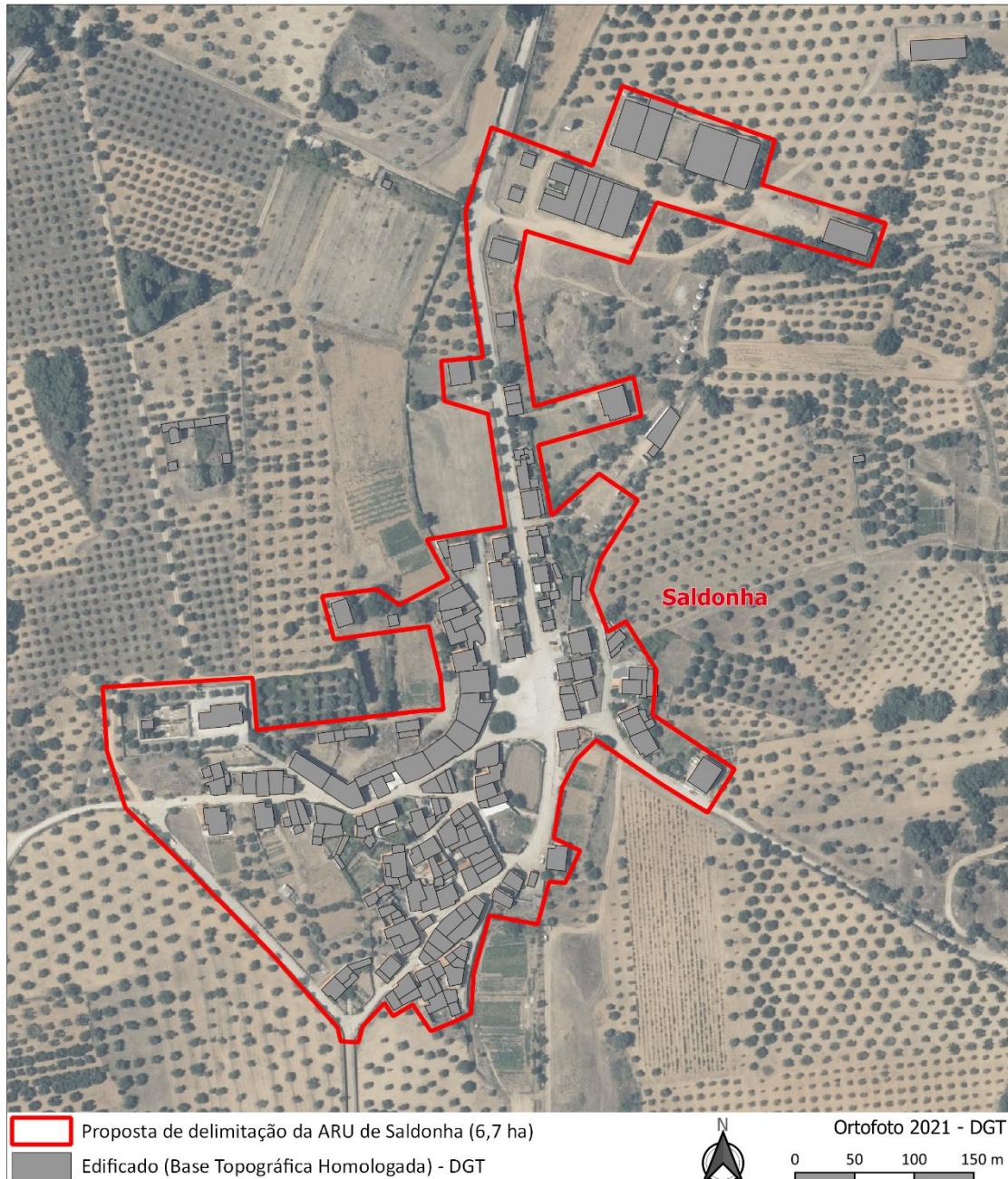
Figura 3. Delimitação da ARU de Saldonha sobre ortofotomapa

A proposta de delimitação da ARU de Saldonha considera 6,7 hectares. Esta proposta teve como base, a aferição entre a área englobada pelo perímetro urbano do PDM em vigor, o proposto em sede da 2. a revisão e a delimitação dos lugares estatísticos do INE. Apresentam-se em anexo as representações sobre o ortofotomapa de 2021 e a base topográfica homologada.