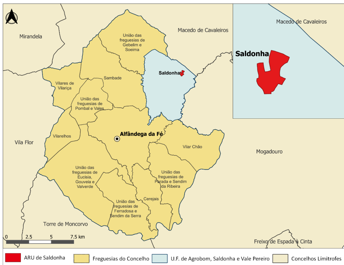
Figura 1. Enquadramento geográfico da ARU de Saldonha

A U.F. de Saldonha, Saldonha e Vale Pereiro contabiliza 211 habitantes, segundo os Censos 2021, distribuídos por um território de 32,6 km 2 . A aldeia de Saldonha dista da sede de Concelho cerca de 18,6 km (sensivelmente, 24 min), e compreende uma área total de 0,30 km 2 .