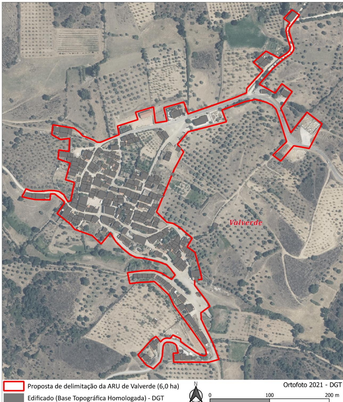
Figura 3. Delimitação da ARU de Valverde sobre ortofotomapa

A proposta de delimitação da ARU de Valverde considera 6,0 hectares. Esta proposta teve como base, a aferição entre a área englobada pelo perímetro urbano do PDM em vigor, o proposto em sede da 2. a revisão e a delimitação dos lugares estatísticos do INE. Apresentam-se em anexo as representações sobre o ortofotomapa de 2021 e a base topográfica homologada.